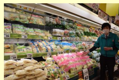
ロシアのスーパー