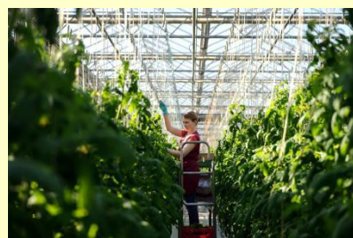
トマト栽培温室(モスクワ)

※今回の研修先は、モスクワ・クラスノダール・サンクトペテルブルクの各都市近郊での視察を予定しており、現在選定交渉中です。